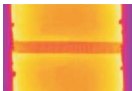
Prozesskontrolle bei der Solarzellenfertigung